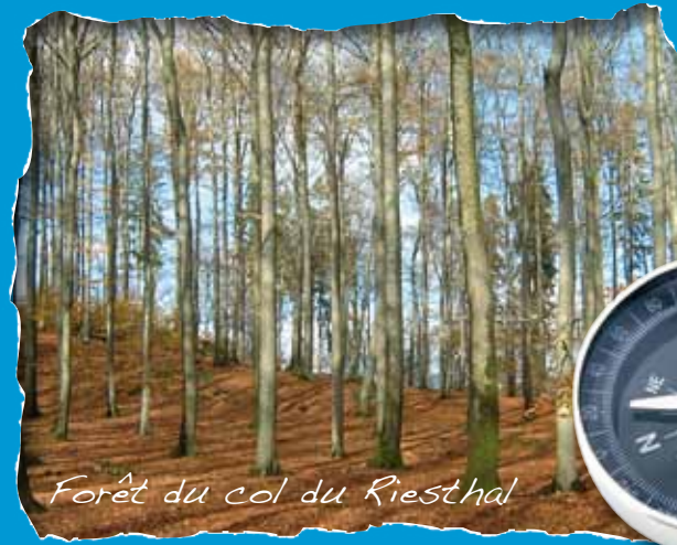
Forêt du col du Riesthal