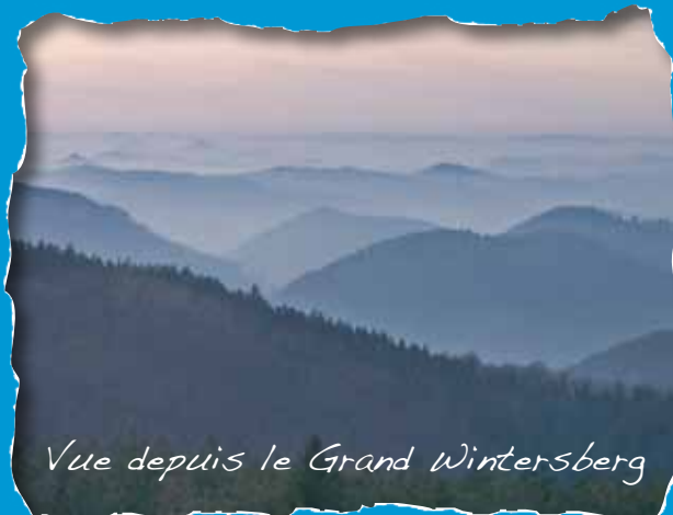
Vue depuis le Grand Wintersberg