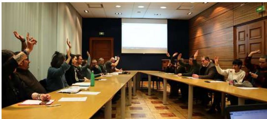
Les 13 membres fondateurs de l'association au soir de l'AG constitutive : Auto-école des Thermes, Camping du Heidenkopf, Casino Barrière, Chaussures Ellen, Ets Gilger, garage Meyer, Le Pâtissier des Thermes, Mary Cohr, Mots de Passage, MW Informatique, Optique des Cuirassiers, Pâtisserie Mary, Toto à vélo.

C'est pour défendre et promouvoir ce savoir-faire de proximité que 13 membres fondateurs ont créé, le 26 janvier dernier, une nouvelle association de commerçants, artisans et hôteliers-restaurateurs. Dès le lendemain de l'AG constitutive, leur première mission a été d'aller à la rencontre de leurs collègues pour présenter l'association et leur proposer d'y adhérer. Leur ambition est de fédérer le plus grand nombre de professionnels de la commune, afin de constituer une association forte et représentative.