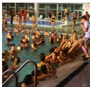
300 participants à la WinterParty des Aqualies (04/02)