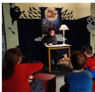
Une seconde édition pour la Nuit de la lecture (20/01)