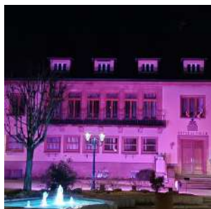
La mairie illuminée pour la Journée internationale de l'épilepsie (14/02)