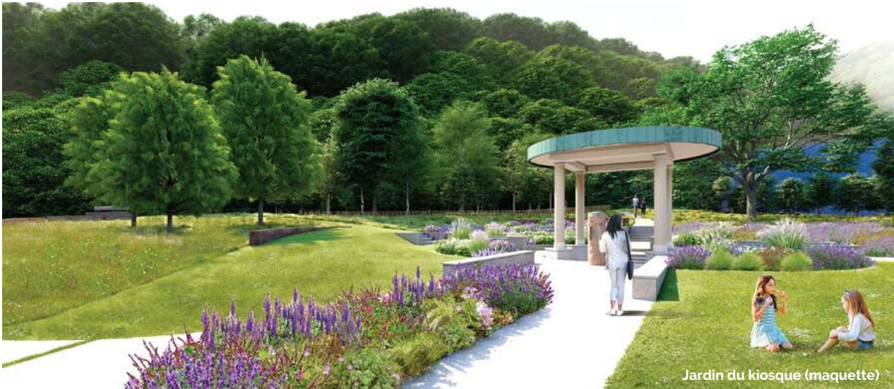
Jardin du kiosque (maquette)