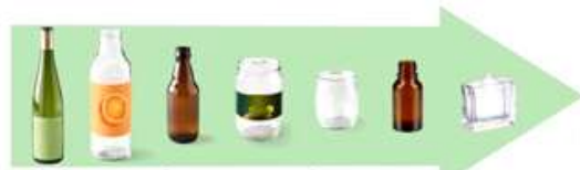
Bouteilles, flacons, pots et bocaux