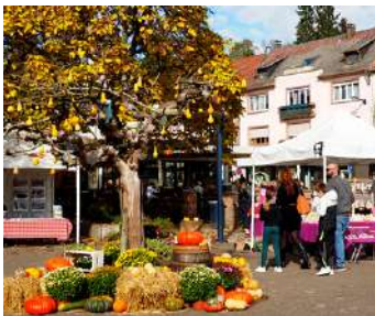
Fête d'automne & du terroir