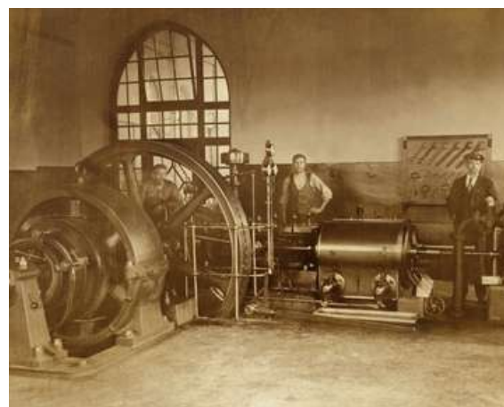
La salle des machines de l'usine d'électricité en 1900