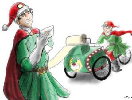
Les Artyzanos ©

03/12 | Déambulation des Artyzanos à partir de 16h au Marché de Noël (Posti Tonttu : rencontrez 2 lutins envoyés par le Père-Noël pour recueillir les vœux des petits et des grands)