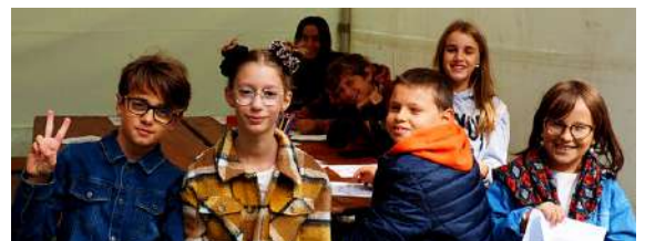
Mandalas anti-stress avec les jeunes élus municipaux