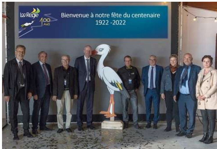
La mascotte de la Régie, Suzie la cigogne, entourée par les intervenants à la cérémonie du centenaire