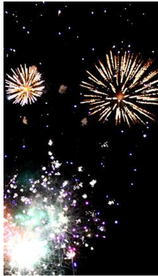
Nuit du Feu