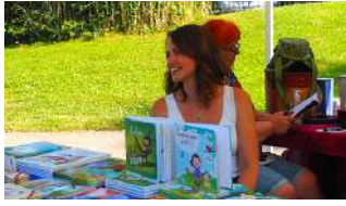
Livres en fête