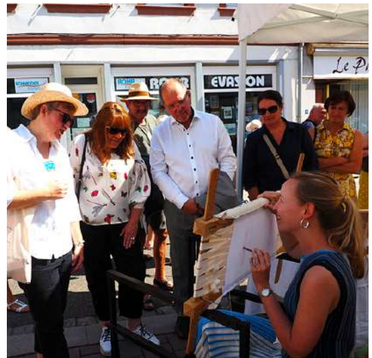
Festival de l'Artisanat