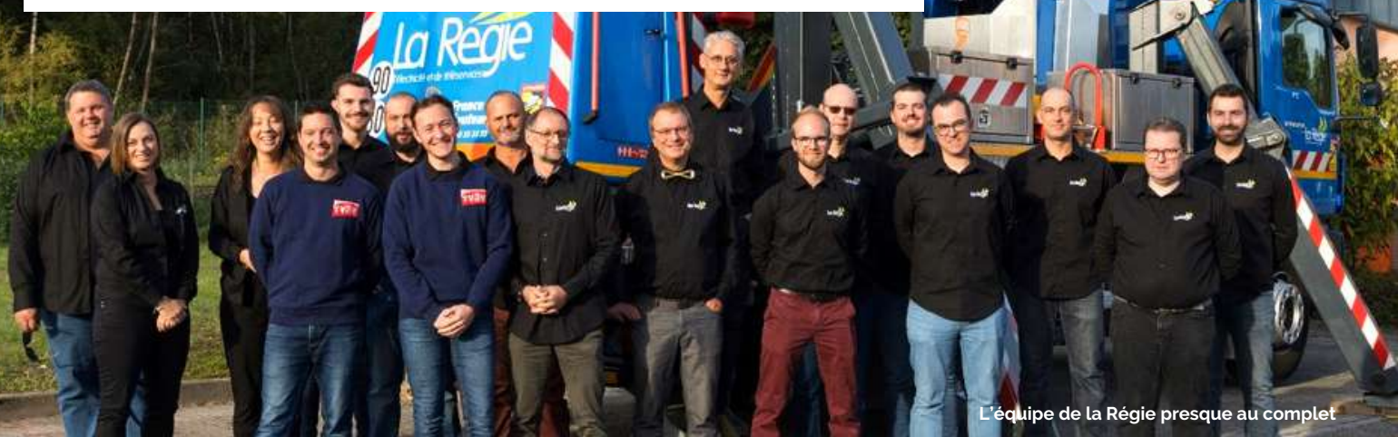
L'équipe de la Régie presque au complet