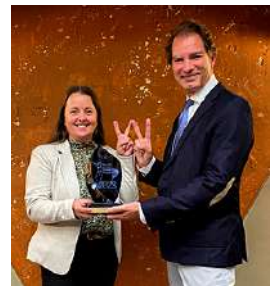
Week-end Bien-être, Niederbronn-les-Bains 3 fois championne du Bien-être