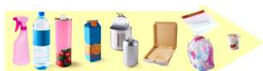
Emballages en plastique, métalliques, en carton, briques alimentaires et tous les papiers