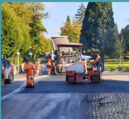
Nouveau tapis d'enrobé avenue de la Libération