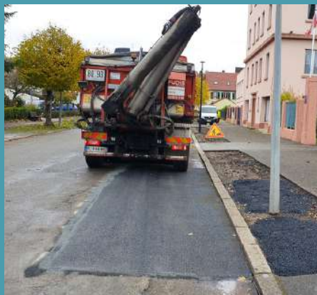
Réfection de chaussée avenue Foch