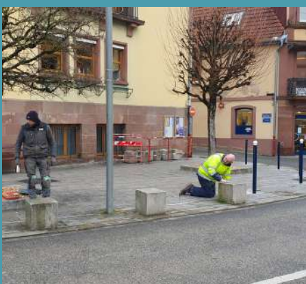
Pose de potelets devant la mairie