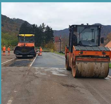
Mise en enrobé de la place de retournement chemin des Fraises