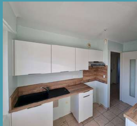
Rénovation complète d'un logement communal rue du Stade