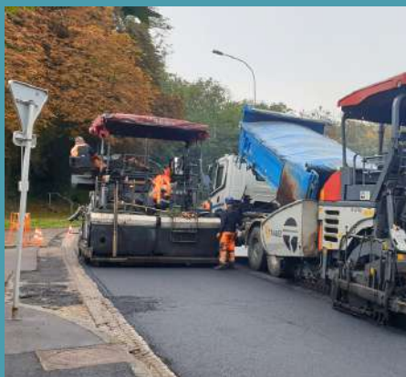
Pose d'enrobé route de France