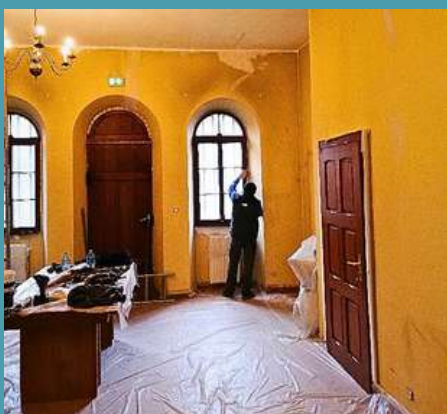
Remise en peinture de la sacristie de l'église catholique