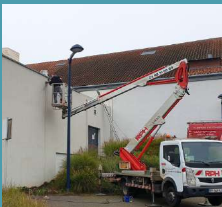
Moulin 9 : rénovation d'une partie de la toiture et installation d'une cuve de rétention des eaux pluviales