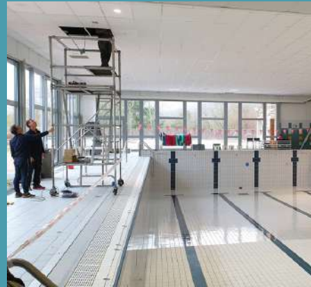
Travaux d'entretien annuels aux Aqualies