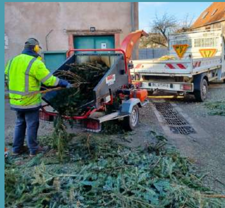
Collecte et broyage des sapins de Noël