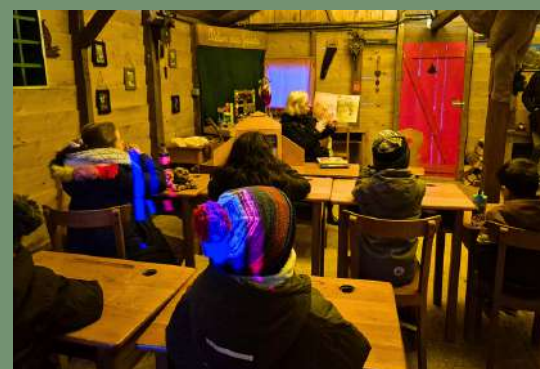
De gauche à droite : Journée citoyenne de plantation de haies le 30/11 • Don de M. Fest le 03/12 : vitrail de l'église Saint Martin datant de 1886 • Fête des aînés au Moulin 9 le 04/12 • Féeries de Noël pendant les 4 week-ends de l'Avent (rallye des lutins avec le RAI, spectacle de feu des Forge-Ciels, balades en calèche, visites du Père Noël, de Christkindel et du Hans Trapp...) • Lecture de contes mensuelle délocalisée dans la Maison du Père Noël le 05/12