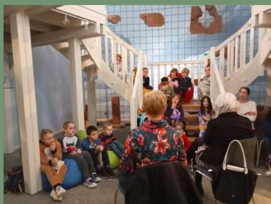
De gauche à droite : Fête de la Sainte Lucie le 13/12 • Bains nordiques aux Aqualies le 11/01 • Cérémonie des Vœux du maire 2025 en présence du maire de Bad Schönborn Klaus Detlev Hüge le 17/01 • Winterparty à la piscine municipale le 01/02 • Remise des prix du concours photo "Niederbronn-les-Bains insolite" le 04/02 • Après-midi jeux de société avec le point lecture le 20/02 • La Chorale Déci-Delà chante pour les résidents de l'Ehpad le 25/02 • Nuit de la lecture au musée le 24/01